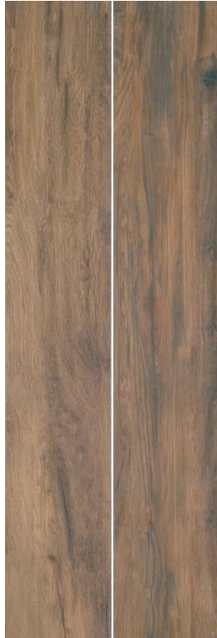
Ecollection Imbuia Clara