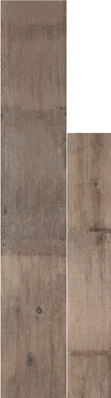
Ecollection Sequoia Mix