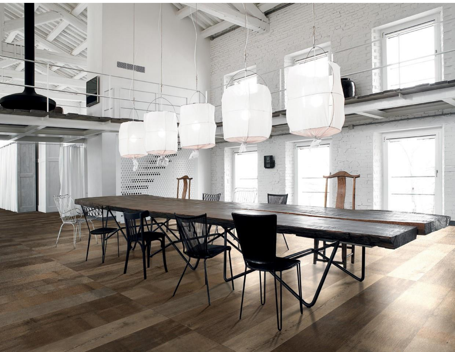
SEQUOIA MIX | V4