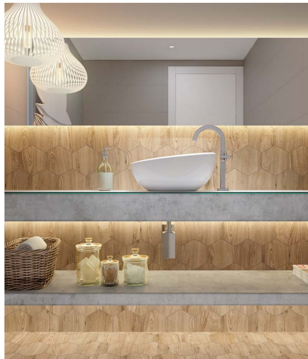
Giardino Hexa BE NAT 17,5x17,5 cm / 7x7"