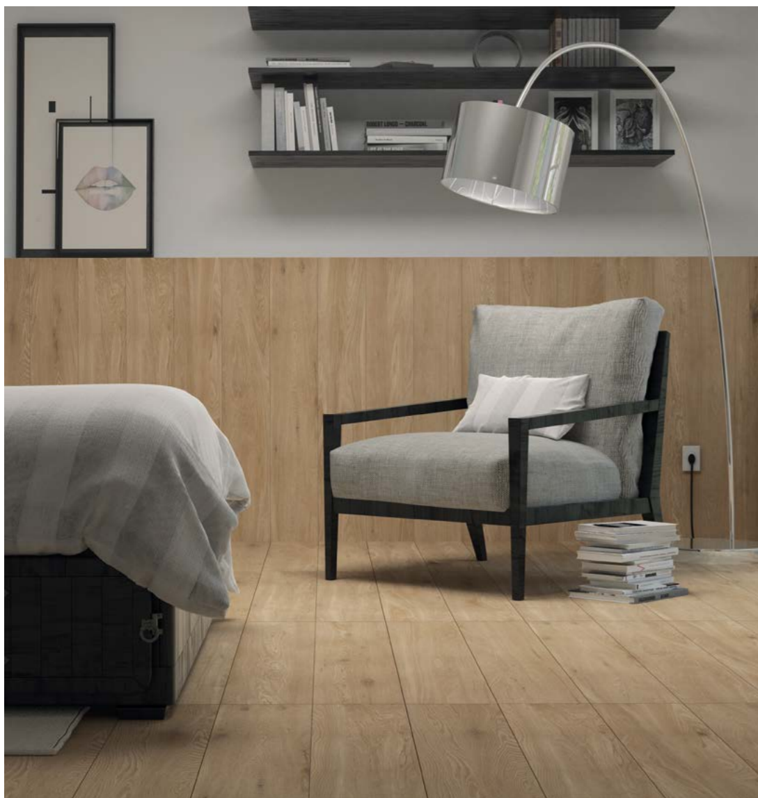
Giardino BE ACT 20x120 cm / 8x48"

La personalidad del carvalho en el confort de los ambientes.