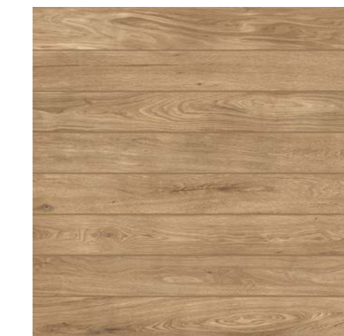
Giardino BE Deck 90x90 cm / 36x36"