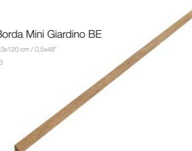
Borda Mini Giardino BE 1,3x120 cm / 0,5x48" V3